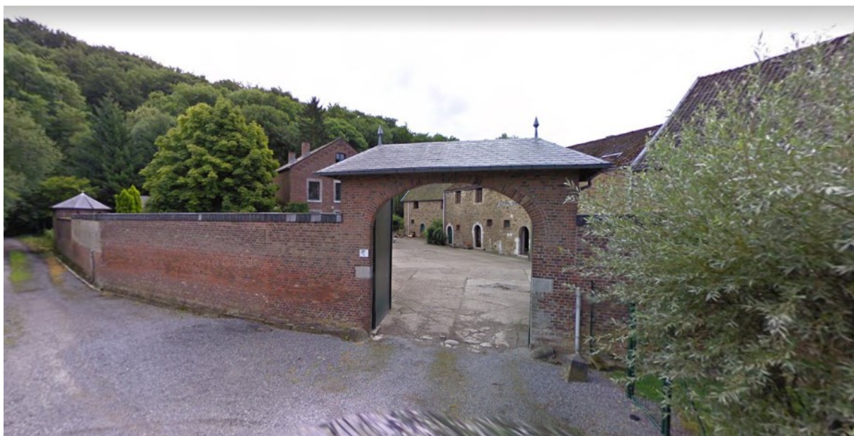
L'ancien moulin-ferme du Bouhet à La Gleixhe – © Google – août 2009

A proximité de l'ancien moulin-ferme du Bouhet à La Gleixhe 1 , dans un site bucolique, le long de l'ancienne route et du ruisseau de Hozémont aux Awirs, ce petit oratoire, construit en 1867-68 par le curé BEAUFAYS , attire de nombreux pèlerins. A l'origine « chapelle Notre-Dame de Lourdes », elle est plus connue sous le vocable de « chapelle de tous les saints ou de Saint Guy ».